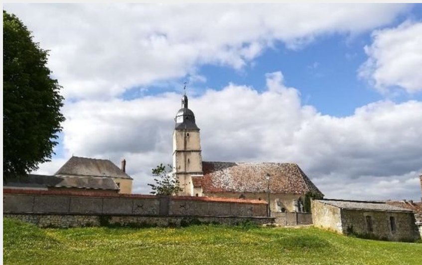
Eglise Saint-Martin - Brunelles