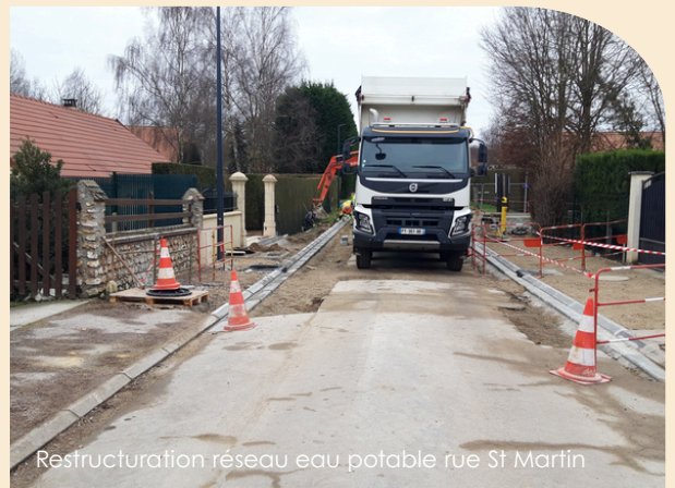
Restructuration réseau eau potable rue St Martin