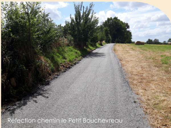
Réfection chemin le Petit Boucheveau

Parallèlement, un programme d'enfouissement des réseaux a été engagé : bas du bourg de Brunelles, rue de la Vallée à Margon (avec remplacement de la canalisation d'eau potable par le SIE de la Berthe), secteur de la Poterie, chemin de l'Espérance Margon et hameau d'Ozée.