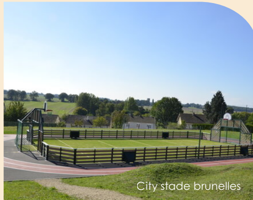
City stade brunelles